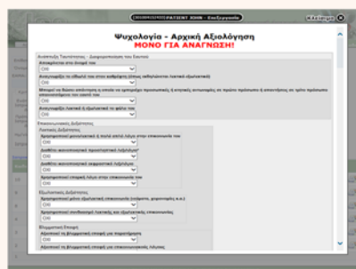
Πρότυπο για τη δημιουργία ηλεκτρονικού φακέλου ασθενή για οργανισμό Πρόνοιας