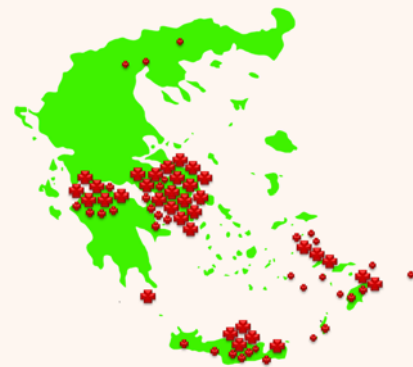
Εγκαταστάσεις λογισμικών ICS στην Ελλάδα από το 2005 και μετά

Το ICS – M είναι τμήμα της σουίτας εφαρμογών Integrated Care Solutions (ICS) η οποία καλύπτει την Πρωτοβάθμια, Δευτεροβάθμια και Τριτοβάθμια φροντίδα υγείας, την Προνοσοκομειακή Επείγουσα Ιατρική, την Πρόνοια και τον τομέα της Αυτοδιαχείρισης του Πολίτη