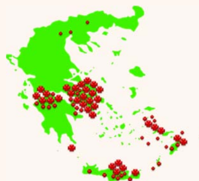
Εγκαταστάσεις λογισμικών ICS στην Ελλάδα από το 2005 και μετά

Το ICS – I είναι τμήμα της σουίτας εφαρμογών Integrated Care Solutions (ICS) η οποία καλύπτει την Πρωτοβάθμια, Δευτεροβάθμια και Τριτοβάθμια φροντίδα υγείας, την Προνοσοκομειακή Επείγουσα Ιατρική, την Πρόνοια και τον τομέα της Αυτοδιαχείρισης του Πολίτη