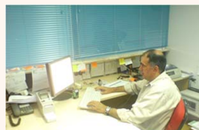
Χρήστης της εφαρμογής ΛΑ