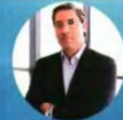
Ο Διευθυντής του Ινστιτούτου Πληροφορικής του ΙΤΕ και Αντιπρόεδρος του ΔΣ ΙΤΕ, Καθηγητής Δημήτρης Πλεζουσάκης